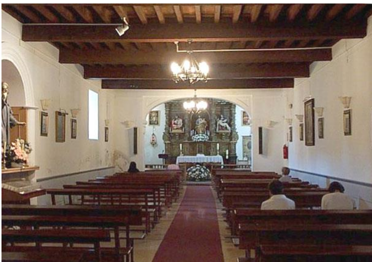
Interior de la capilla

La capilla del Hospital de San José consta de una sola nave alargada. Su cabecera está cubierta por una cúpula, rematada por una airosa linterna.