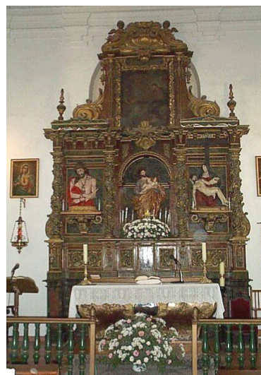
Vista general del retablo

La capilla cuenta con el retablo de estilo "churrigüesco" que vemos en la imagen. Churriguera (1650-1723) inició en España un estilo de retablos barrocos que luego tomaría su nombre. Se distingue, sobre todo, por utilizar columnas salomónicas (con fuste de desarrollo helicoidal) y profusamente adornadas con hojas y racimos. Desconocemos su autor. El retablo está dedicado a San José, cuya efigie con el Niño en brazos se encuentra en el hueco central. De las tres esculturas que componen el retablo, la de mayor valor artístico es, sin duda, el busto del Ecce-Homo.