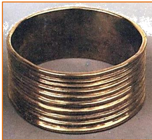
Brazalete de oro hallado en Getafe

Además se extrajeron huesos pertenecientes a animales característicos de diferentes épocas climáticas: mamut ( Mammuthus primigenius ), elefante antiguo ( Paleoloxodon antiquus ), ciervo, rinoceronte, etc. Ello demuestra la existencia de vida en la zona desde hace más de cien mil años. También existieron poblamientos humanos en el término municipal durante la Edad de los Metales.